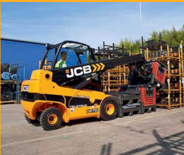
Работа с опрокинувшимися грузами