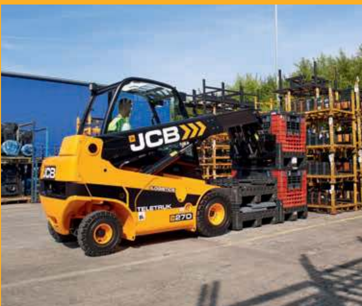
Груз скантован и помещен на место